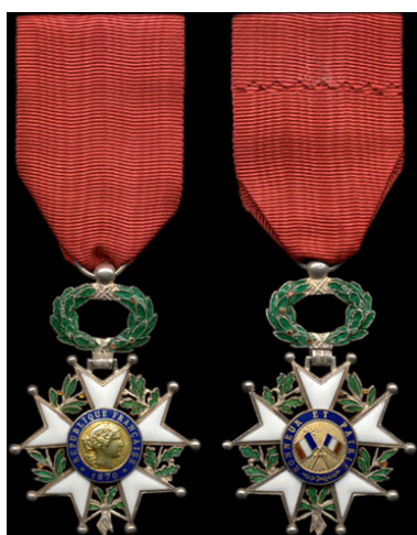
Figure 1 Croix de chevalier avers et revers

La Légion d'honneur est un ordre national français qui fut mis en place par Napoléon Bonaparte en 1802 1 . Il s'agit du premier et du plus élevé ordre national français ayant pour but de récompenser le courage des militaires ainsi que les services civils. C'est la plus haute distinction française connue mondialement. La Légion d'honneur est une distinction honorifique ne conférant aucun avantage matériel ou financier, cependant elle est une fierté inestimable pour les personnes décorées et leurs proches, et représente un exemple de civisme rendu public 2 . La légion d'honneur est une décoration sous forme de médaille représentée par une étoile à cinq rayons doubles surmontée d'une couronne de chêne et de laurier, son ruban est de couleur rouge. A l'avant, on remarque Marianne, effigie de la République, au revers, deux drapeaux tricolores avec l'inscription « honneur et patrie » et sa date de création. Cette décoration se porte sur le côté gauche, et avant tout autre insigne de décoration française ou étrangère, elle est généralement portée lors de cérémonies officielles, sinon on optera pour des insignes de boutonniers tels que des rubans ou des rosettes.