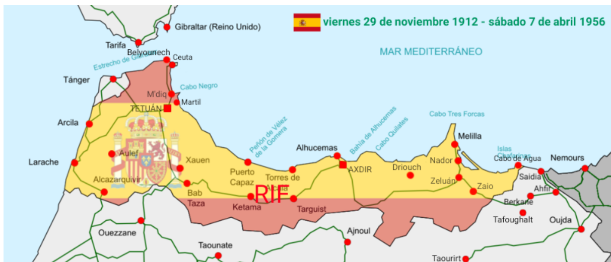
Figure 4 Carte de la région du RIF

Le Rif est une région montagneuse située dans le nord du Maroc, bordée par la mer Méditerranée à l'est et le détroit de Gibraltar à l'ouest 31 . Cette région a connu une histoire tumultueuse marquée par des conflits internes entre tribus, la colonisation et la résistance aux forces françaises et espagnoles lors de la guerre du Rif dirigée par Abdelkrim de 1921 à 1924. En effet, le Rif était une région indépendante dans l'ancien Maroc, mais en 1912, la région du Rif se retrouva sous protectorat espagnol et français 32 .