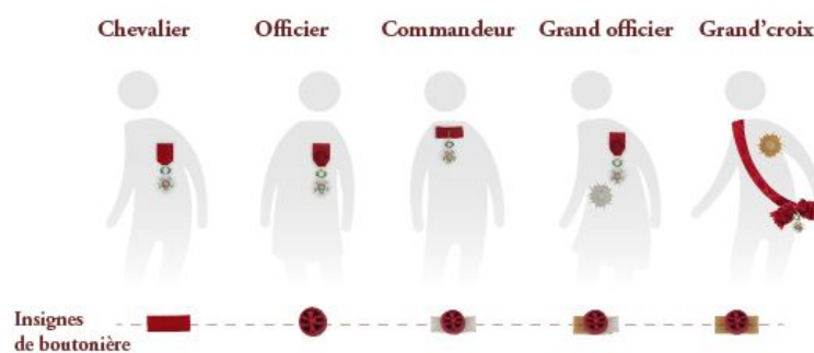
Figure 2 Port de l'insigne