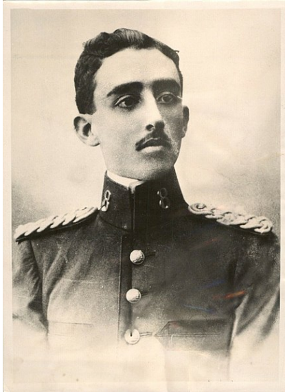
Figure 3 Franco au régiment d'infanterie de Ferrol (1910).

Francisco Franco Bahamonde aussi appelé Franco, figure de la politique espagnole, né le 4 décembre 1892 au Ferrol, en Galice, et mort le 20 novembre 1975 à Madrid, grandit dans une famille de militaires, principalement au service de la marine.